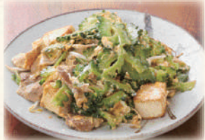
ゴーヤーちゃんぷるー 680円(税込748円)