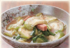
ナーベラーみそ煮 720円(税込792円)