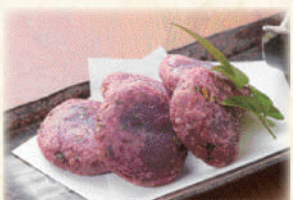
紅芋うむくじ天ぷら 680円(税込748円)