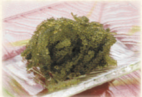
海ぶどう 650円(税込715円)