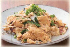
ふーちゃんぷるー 650円(税込715円)