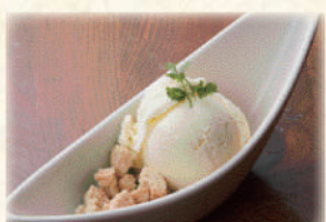
シークァーサーアイス 380円(税込418円)