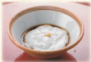
ジーマーミー豆腐 500円(税込550円)