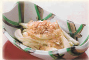
島らっきょうの塩漬け 680円(税込748円)