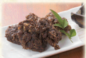
もずく天 580円(税込638円)