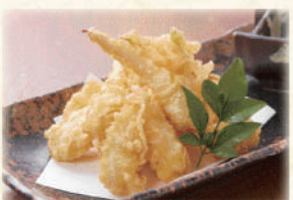
島らっきょうの天ぷら 700円(税込770円)