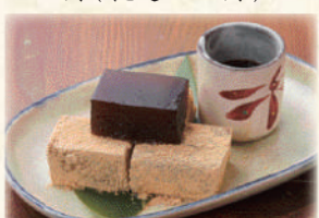
黒糖くずもち 350円(税込385円)