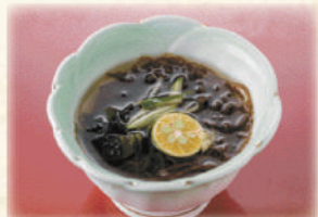
島もずく酢 500円(税込550円)