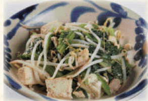
ちきなーちゃんぷるー 680円(税込748円)