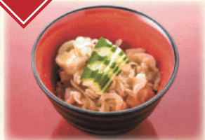
ミミガー酢みそ和え 480円(税込528円)