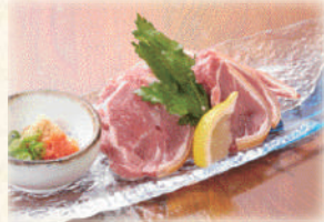
ヒージャー刺し 1,580円(税込1,738円)