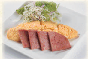
ポーク玉子 650円(税込715円)