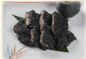
ミノグル 680円(税込748円)