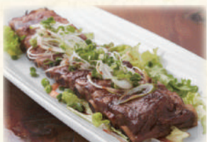
ソーキやわらか一本揚げ 1,280円(税込1,408円)