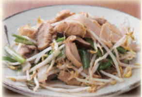
中身イリチー 680円(税込748円)