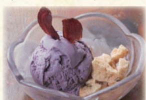
紅山芋アイス 380円(税込418円)