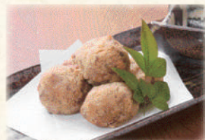
どうる天 580円(税込638円)