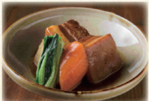
ラフテー黒糖煮 750円(税込825円)