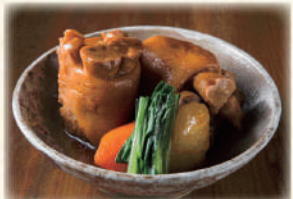
てびちの煮付け 780円(税込858円)