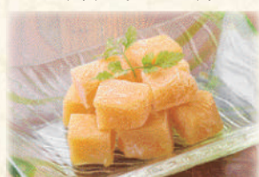
マンゴーシャーベット 480円(税込528円)